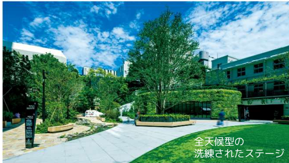
全天候型の 洗練されたステージ