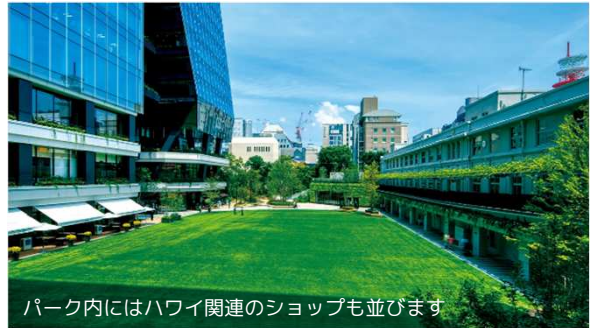
パーク内にはハワイ関連のショップも並びます